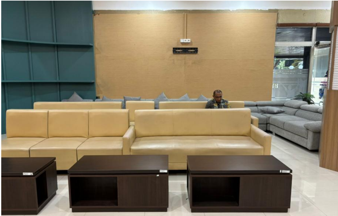
Ruang tunggu pelayanan