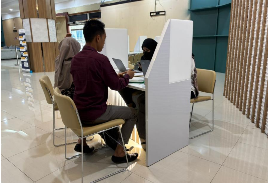
Ruang Konsultasi Pelayanan