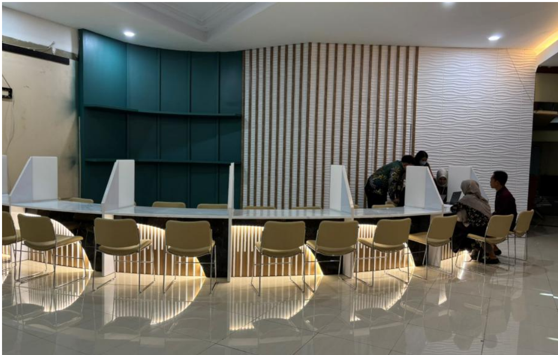
Ruang Konsultasi Pelayanan