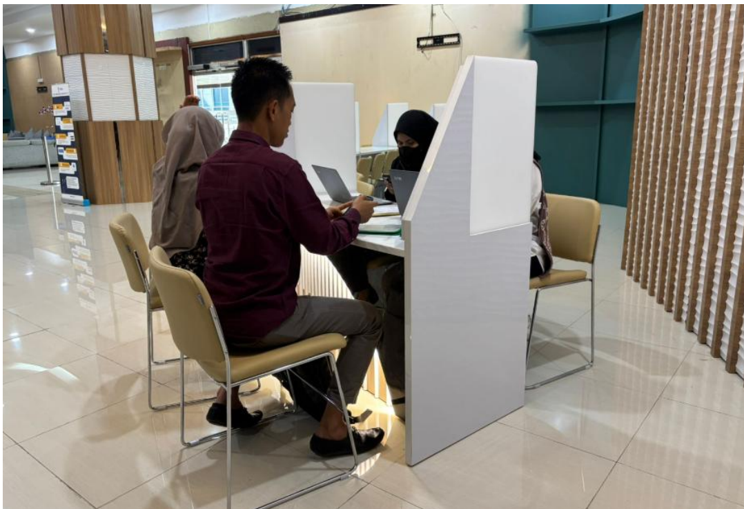
Ruang Konsultasi Pelayanan