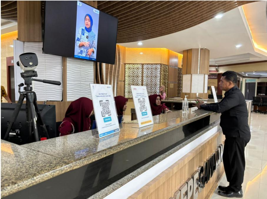
Front Office dan Informasi TV Media