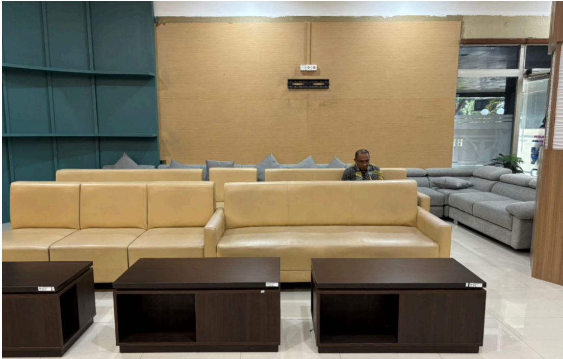
Ruang tunggu pelayanan