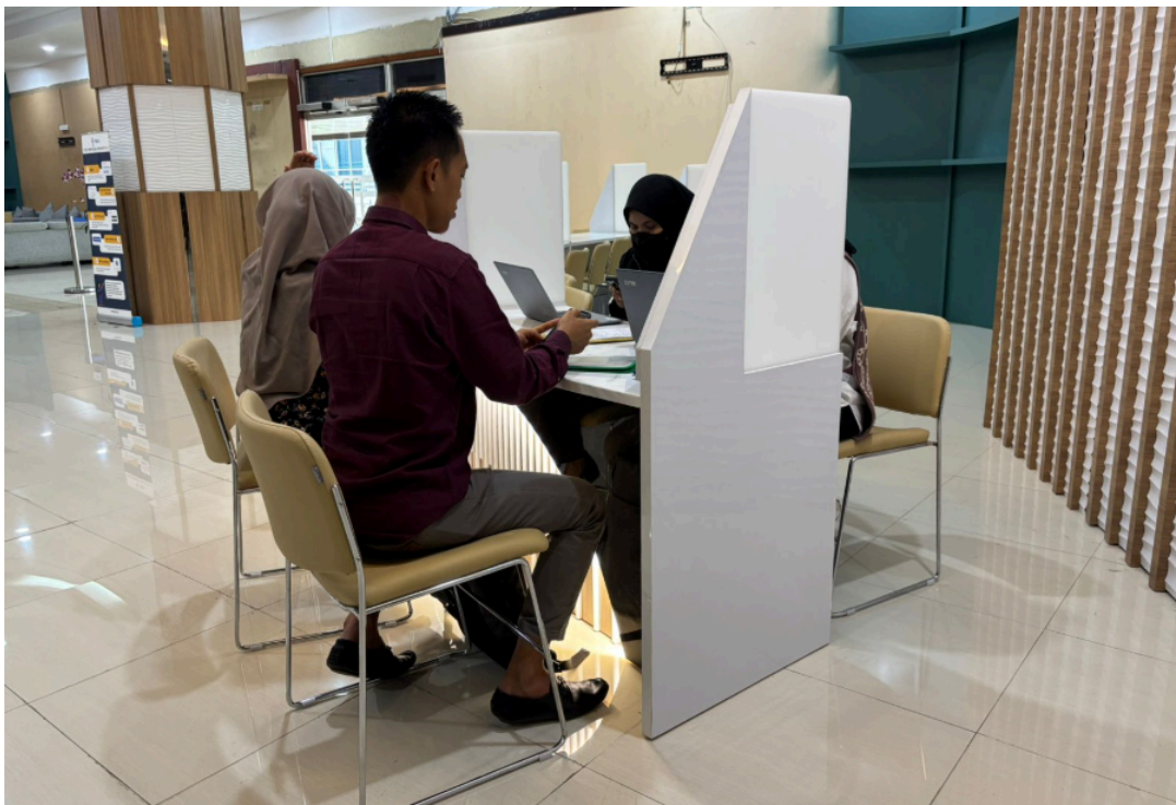
Ruang Konsultasi Pelayanan