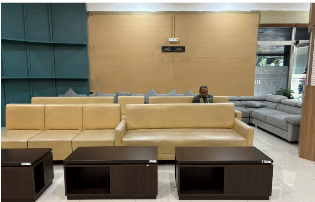
Ruang tunggu pelayanan