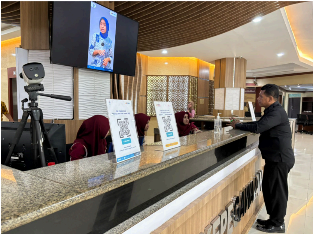
Front Office dan Informasi TV Media