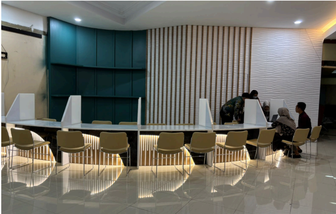
Ruang Konsultasi Pelayanan